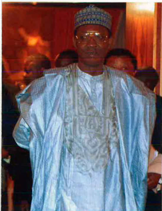
Idris Déby, president del Txad continua gaudint del suport de França.

E l president del Txad, Idris Déby Itno, més aïllat que mai malgrat que va ser reelegit a principi del passat mes de maig, es troba més afeblit que mai, sobretot perquè ha d'afrontar una guerrilla que rep el suport del Govern de Sudan, país veí, i a la insurgència d'un altre moviment integrat per membres de la seva pròpia família. A la vegada, la crisi del règim de Deby preocupa el Govern francès, que manté un dispositiu militar al Txad des de 1986, i inquieta la diplomàcia nord-americana, ara distanciada del president, així com de la Unió Africana (UA), que tem que les diferències amb el Sudan provoquin una guerra entre els dos estats. "La situació és fràgil, i el Txad és un país molt important per a l'estabilitat de la regió", va admetre fa unes setmanes la ministra francesa de Defensa, Michèle Alliot-Marie. Déby, considerat per França un estadista que garanteix l'estabilitat en l'excolònia, productora de petroli, va aturar fa un mes una ofensiva del Front Unit pel Canvi (FUC) que va arribar fins a Ndjamena, la capital del Txad. Alguns testimonis de la batalla de Ndjamena, del 13 d'abril, asseguren que els militars francesos van ser decisius per salvar el règim de Déby, quan els combatents del FUC ja