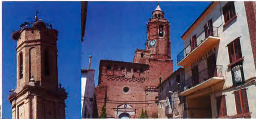
Les cigonyes al campanar de Saidí i, al costat, l'església i la Casa de la Vila del Campell.

Però, pregunten, retòricament, "que els crea, els enfrontaments? Els polítics. Tots. Per benefici propi". Ben mirat, l'embolic, expliquen entre uns i altres, "ja va venir de separar-les, les parròquies, que pertanyien a Lleida, les de parla catalana. Una cosa que havia estat de tota la vida ara ho separen i creen lo problema aquest". Perquè, raonen, "que mos han demanat permís, a natros, per dir si volem lo bisbe de Barbastro o de Lleida?" I conten, per exemple, que el mossèn que tenien abans, que era de Montsó, no va voler donar la comunió a dos xiquets perquè el seu pare havia fet un article contra la segregació de les parròquies. Que per què s'hi encaboten tant,