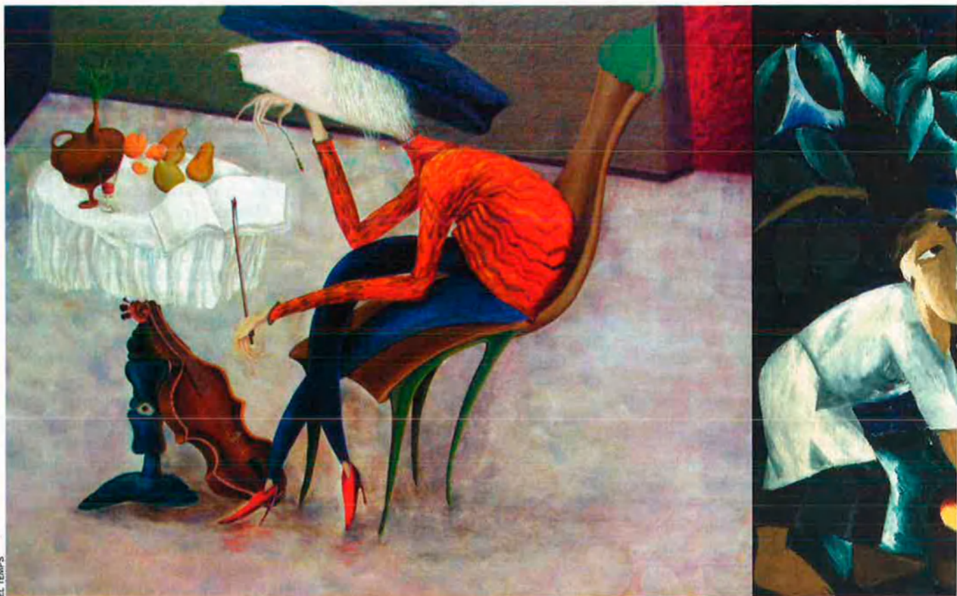
A l'esquerra, Cri , de Roman Kamaliev. Un dels representants de la jove pintura ucraïnesa. A la dreta, Camperols recollint pomes , de Natalia Gontxarova. Galeria Estatal Tretyakov, Moscou. Gontxarova, està exposada actualment al Guggenheim de Bilbao.

E uropa ha après a valorar l'art rus i soviètic anterior –no gaire– i posterior –encara menys– a la revolució russa, però en veritat hi va haver un període d'encara no dues dècades que valen per tot plegat, de la mateixa manera que el primer renaixement italià es basa en pocs noms i pensadors treballant plegats en un escàs lapse. La resta serà mímesi, contrareforma i manierisme.