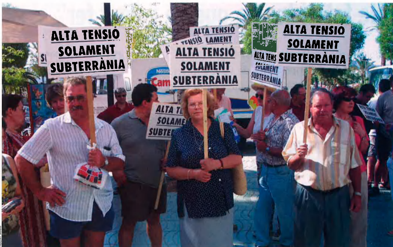
A Eivissa hi ha hagut grans mobilitzacions rurals contra projectes concrets.