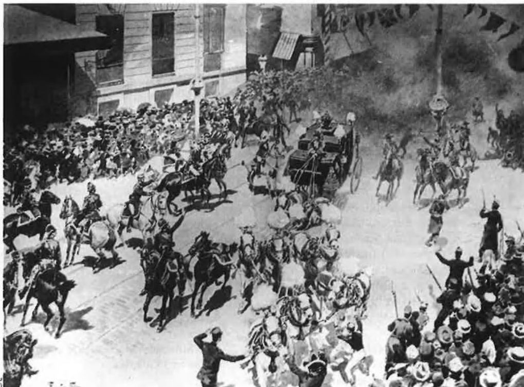
Gravat que reproduïx l'atemptat contra Alfons XIII el dia de la seva boda. La bomba, llançada per l'anarquista català Mateu Morral, va causar una vintena de morts.

Amb una confusió enorme i gent fugint en totes direccions, ben aviat es va sospitar d'un dels pisos del número 88, on es trobava ubicada una casa de dispeses. Al mateix balcó hi havia dos ferits i poc temps després la Guàrdia Civil instruïa les primeres diligències. Un dels hostes havia arribat feia molt pocs dies. Per a la policia era clar que