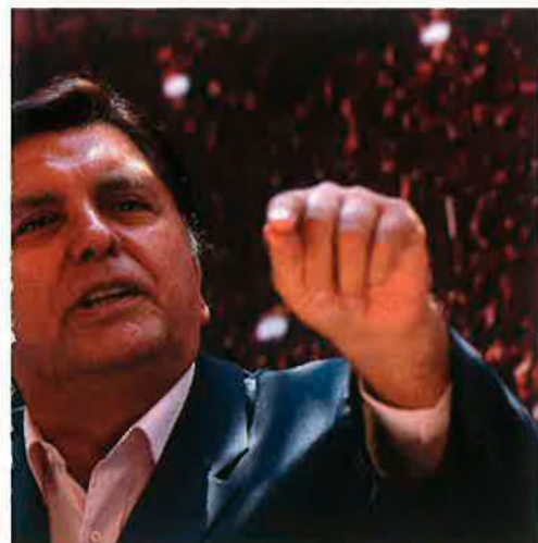
Ollanta Humala, a l'esquerra, i Alan García, en la recta final de la campanya de les eleccions presidencials del Perú.

va afirmar que revisarà el Tractat de Lliure Comerç amb els Estats Units (TLC), recentment signat per l'actual president, Alejandro Toledo, i també els contractes amb les empreses multinacionals que no contribueixen al benefici del país. "Revisarem els contractes amb les multinacionals per rescatar els nostres recursos naturals", va dir Humala, en una línia que recorda la política que ha adoptat Evo Morales a Bolívia. Per la seva banda, Alan García va prometre governabilitat sense grans canvis. "El canvi vindrà amb el creixement econòmic, amb la inversió nacional i estrangera", va dir García, tot afirmant que amb un eventual govern seu el PIB del Perú creixeria un 7% anual.