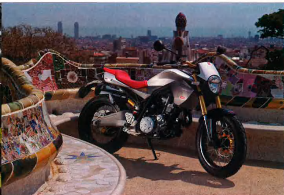
Derbi és una de les marques més potents del país. La setmana passada va presentar la seva gran aposta, una moto de 650cc, batejada amb el nom de Mulhacón 659.

sa Honda i Yamaha, principalment— i les que han desaparegut: Bultaco, Sanglas i Ossa. La magnitud d'aquesta indústria a casa nostra resulta evident. Si fem càlculs, el sector genera a l'estat uns 22.000 llocs de treball, entre directes i indirectes. Dels primers, un 85% es concentra a Catalunya. Dels segons, només cal pensar en l'important clúster d'empreses de components que fan possible el manteniment d'aquesta indústria.