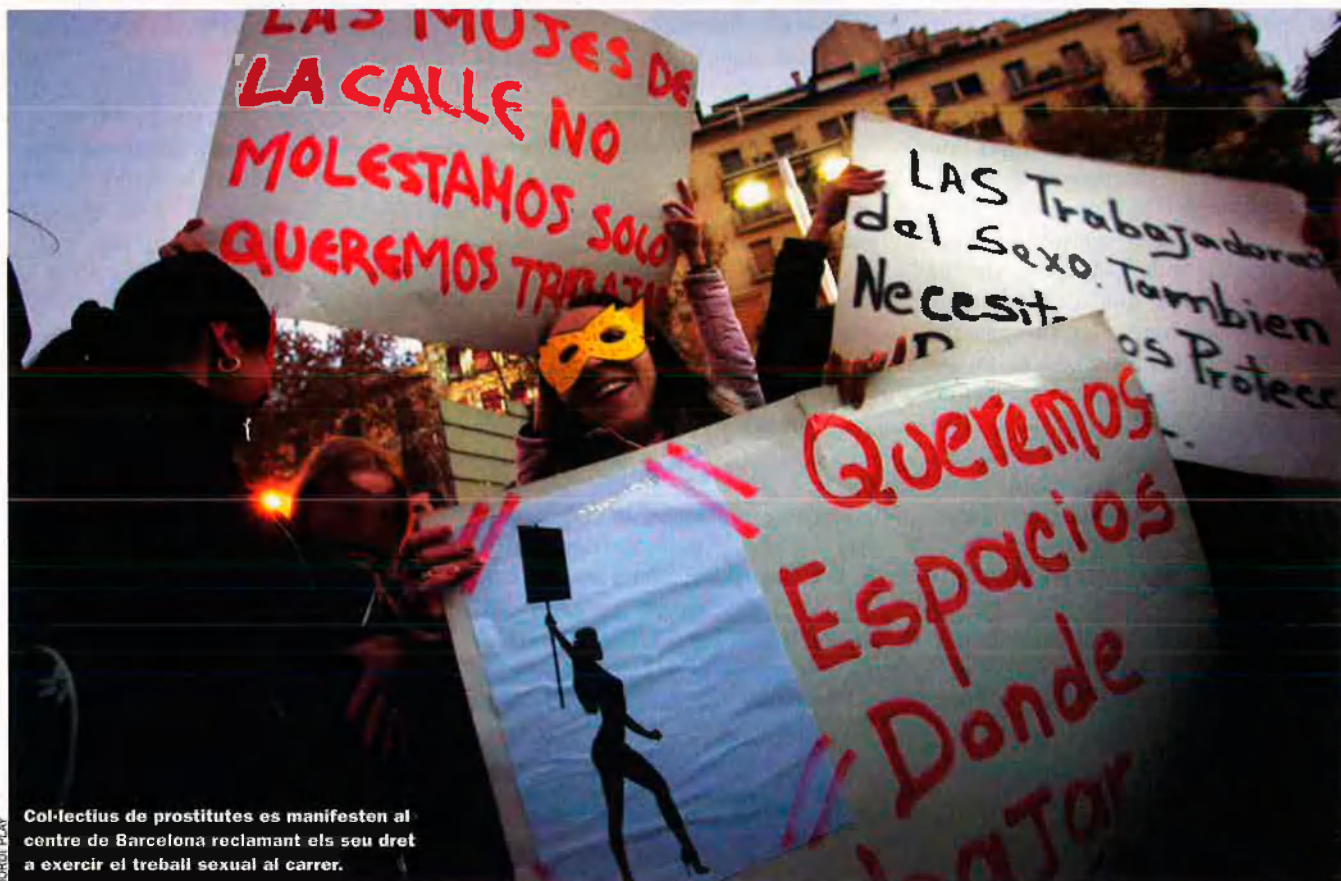
Col·lectius de prostitutes es manifesten al centre de Barcelona reclamant els seu dret a exercir el treball sexual al carrer.

La Generalitat de Catalunya redacta una llei per prohibir els negocis sexuals a la via pública, l'Ajuntament de Barcelona ja ho ha fet i el de València ho farà per netejar la cara de la ciutat abans que el papa Benet XVI la visite al juliol.