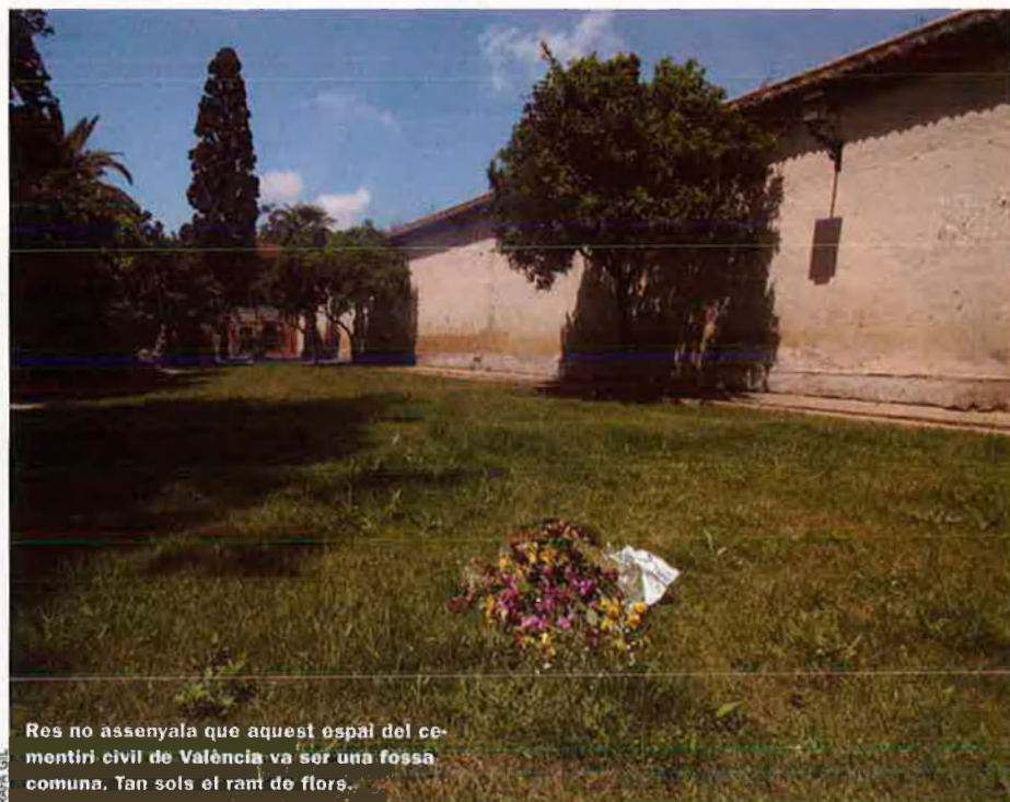
Res no assenjala que aquest espai del cementiri civil de València va ser una fossa comuna. Tan sols el ram de flors.