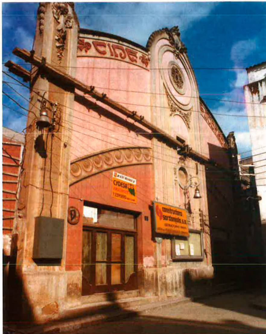
Façana modernista del Cine Modern de Lloret de Mar (Selva), únic element salvat de l'enderroc. Va ser construït l'any 1913. La sala també era un teatre.

El capítol de la censura faria tot un llibre si l'historiador hi hagués posat totes les anècdotes. Però només ocupa una vintena de les 710 pàgines. Calia deixar espai als restants capítols per poder-hi explicar, amb força detall, la història del cinema al Gironès, Alt i Baix Empordà, el Pla de l'Estany, la Garrotxa, la Selva, el Ripollès i la Cerdanya.