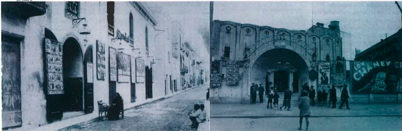
Cinema Mundial de Sant Feliu de Guixols (Baix Empordà), antic Saló Lloveras, obert el 1912. Actiu fins al 1936, l'edifici s'enderrocà el 1969. Teatre Albéniz de Girona a final dels anys vint, aixecat el 1923 i substituït el 1997 pel complex Albéniz Centre.

vant del feix de llum perquè els menuts no veiessin certes coses". Com a Cinema Paradiso .