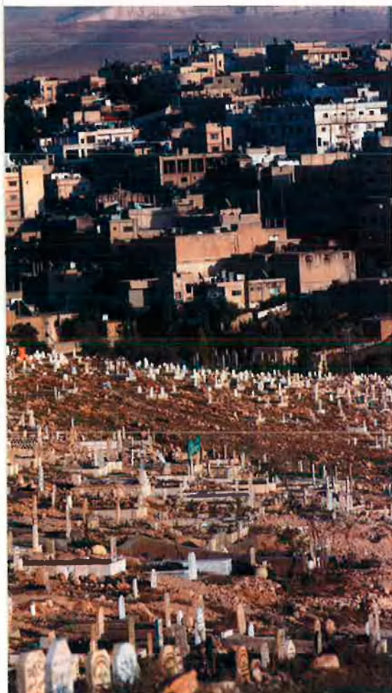
Vista general d'Al-Zarqa, una ciutat industrial situada a 30 km d'Amman, la capital jordana.