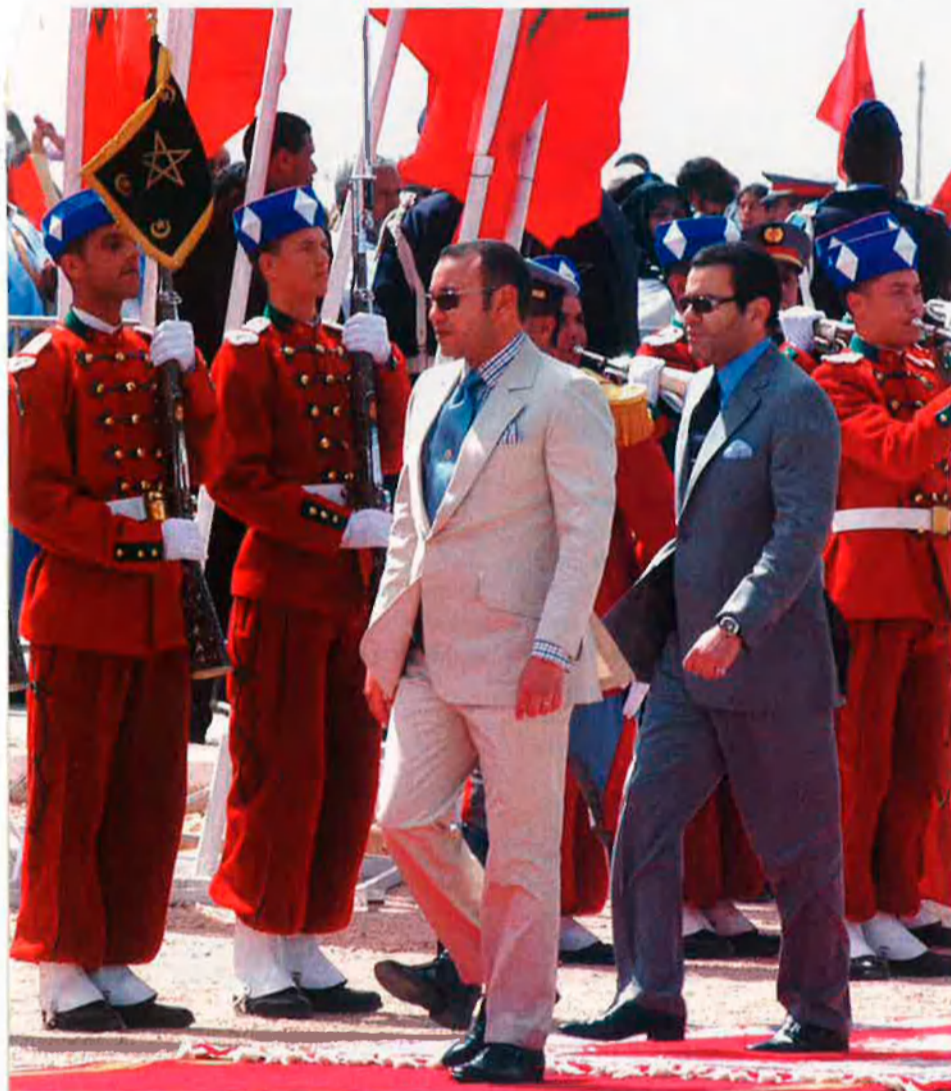
El rei del Marroc, Mohamed VI, passa revista a les tropes de l'exèrcit marroquí a Al-Aaiun, el passat 21 de març, durant les jornades de visita que va fer al Sàhara Occidental.

Nous actors en el cada dia més complicat conflicte sahrauí. L'alliberament de militants de drets humans i activistes polítics a favor de la indepen-