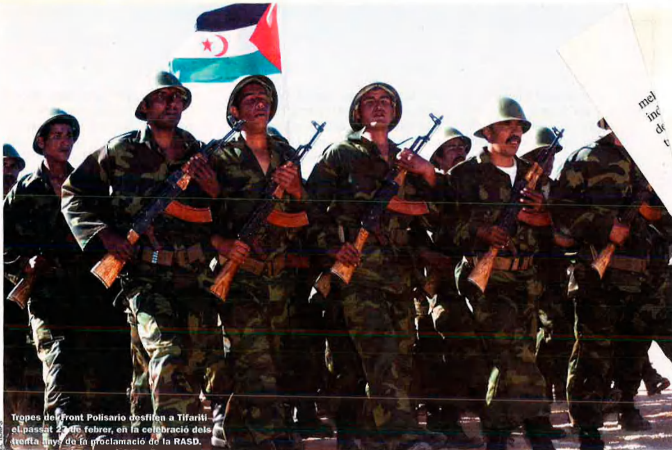
Tropes del Front Polisarió desfilen a Tifariti el passat 23 de febrer, en la celebració dels trenta anys de la proclamació de la RASD.