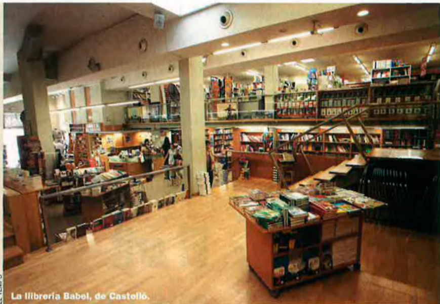
La llibreria Babel, de Castelló.