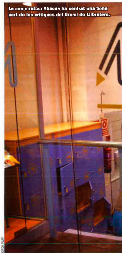
La cooperativa Abacus ha centrat una bona part de les crítiques del Gremi de Llibreters.

ha tingut a la Gran Bretanya el fet de deixar el preu lliure per al llibre. Una situació que també es va viure a França, on finalment es va tornar a la política del preu fix. A Alemanya no regeix cap llei del llibre, però en canvi, regna