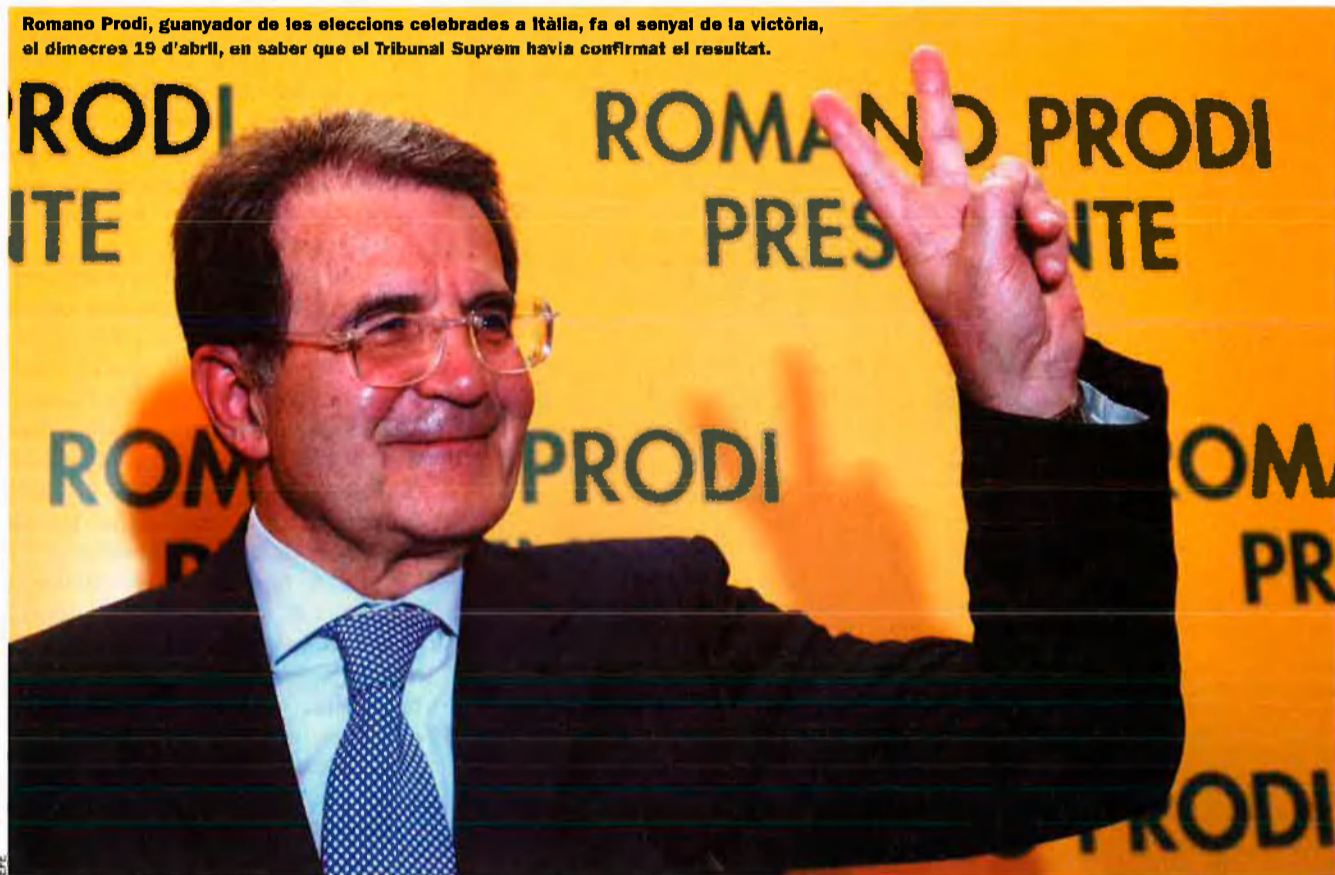
Romano Prodi, guanyador de les eleccions celebrades a Itàlia, fa el senyal de la victòria, el dimecres 19 d'abril, en saber que el Tribunal Suprem havia confirmat el resultat.

A la complicada situació esdevinguda arran de l'empat en les eleccions italianes del dia 10 d'abril s'hi ha afegit la retirada del president de la República, Carlo Ciampi, que és qui havia de nomenar Prodi i demanar-li la constitució del nou govern. Mentrestant, Berlusconi segueix a la cadira de primer ministre, dient que ell és el vencedor moral de les eleccions.