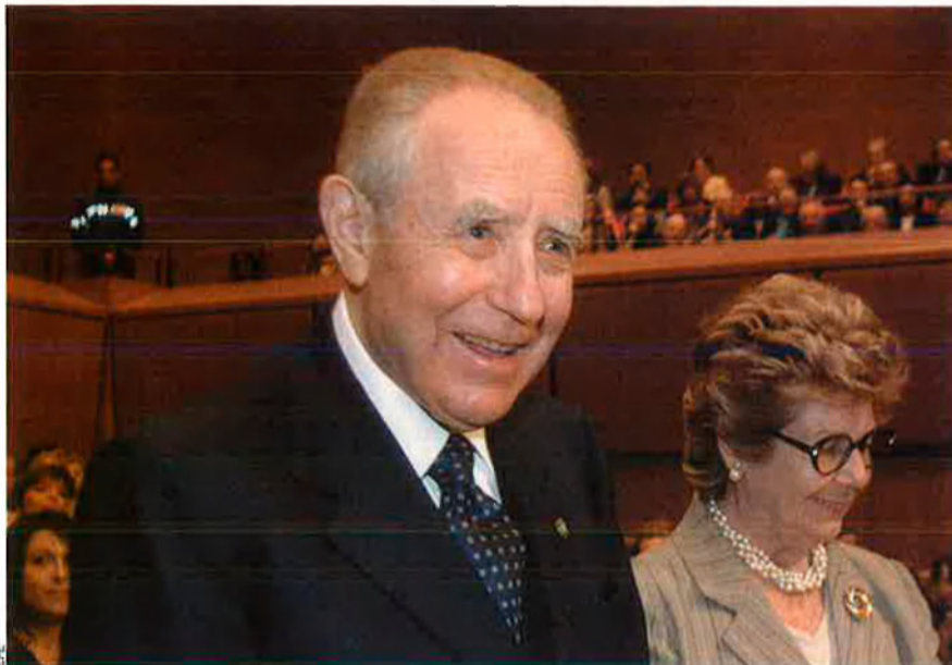
El president de la República italiana, Carlo Ciampi, ha decidit deixar el seu càrrec, però ho farà enmig de la polèmica.

i la Casa de les Llibertats." També les reformes institucionals i constitucionals. Rutelli, més que probablement un dels futurs ministres del govern Prodi, creu que serà possible un partit democràtic unit, tot i que Rutelli aposta per obrir-lo als moderats, i Piero Fassino, dels Demòcrates d'Esquerra, vol obrir-los a La Rosa nel Pugno, més radical. "Un gran partit nacional no podrà ser ni confessional ni anticlerical", creu Rutelli. Per tant, la idea que l'Ulivo s'unifiqui escara ha de madurar.