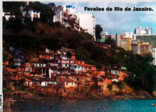
Faveles de Rio de Janeiro.