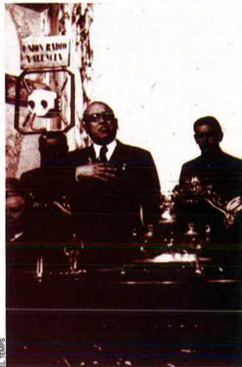
Manuel Azana presidint un acte a València mentre era president de la República.

Aquell enterrament era un esdeveniment delicat per al règim de Vichy. Calia evitar qualsevol element susceptible de provocar una protesta diplomàtica del Govern de Madrid. La presència policial és evident. S'ha prohibit que el taüt es cobreixi amb la bandera republicana (Azana havia demanat que s'emprés l'ensenyà corresponent a la Guàrdia Presidencial, però havia estat sa-