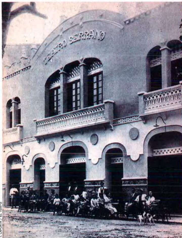
L. LAPORTA / EL TEMPS