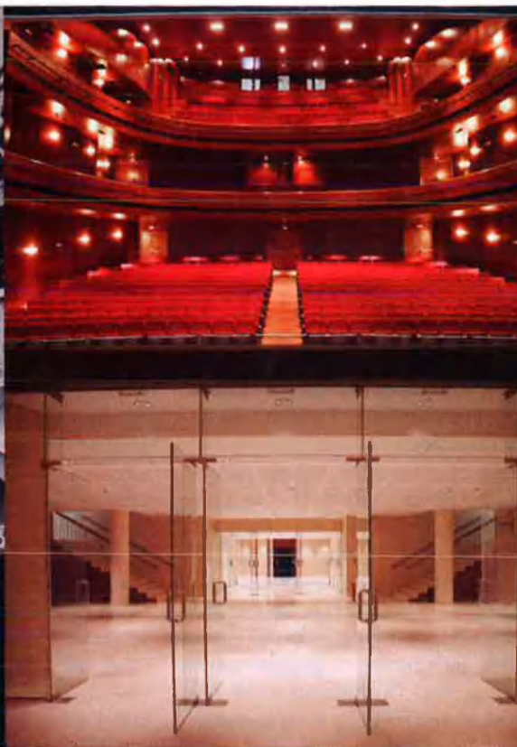
A l'esquerra, la façana principal del Teatre Serrano a principi segle XX, que s'ha respectat i ha estat restaurada. A dalt, e de butaques de la sala principal i el vestibul d'entrada del t tal com han quedat després dels treballs de rehabilitació.