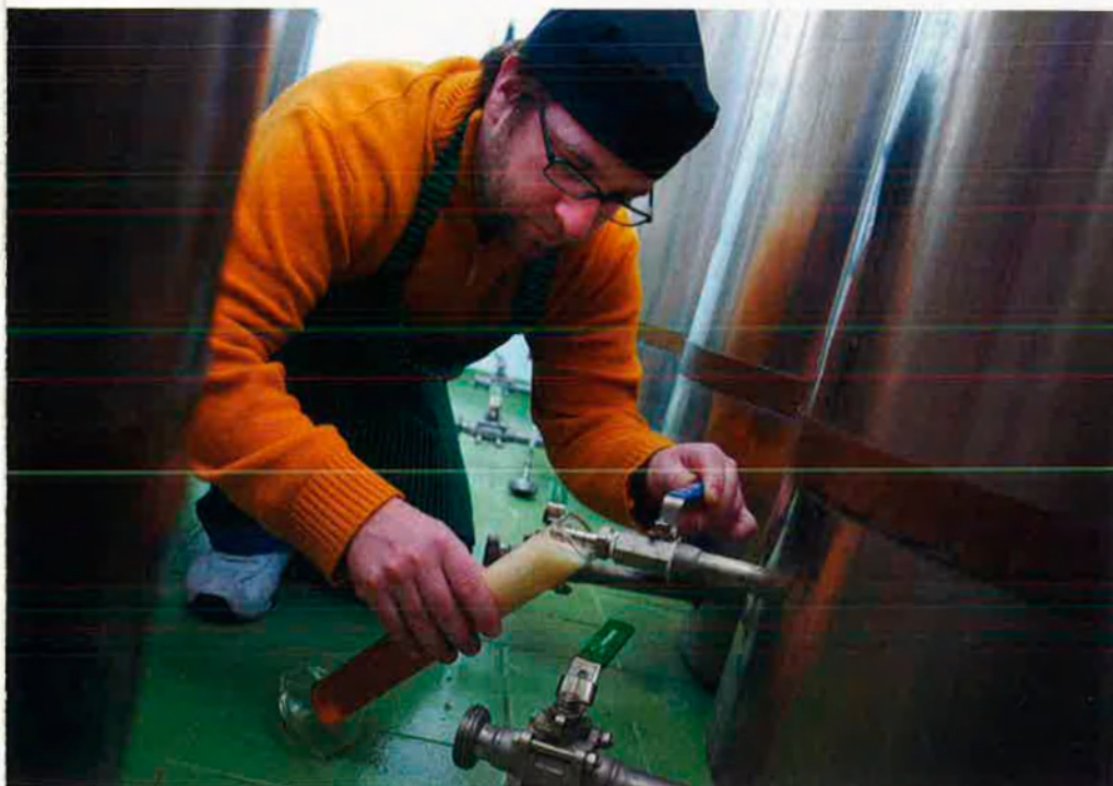
Amb una setmana de fermentació i tres més de maduració, la cervesa artesanal està llesta per passar a l'ampolla, on acabarà el procés de fermentació.

“Aigua, malt d’ordi, llúpols i llevats. A una cervesa no li cal res més”, així explica Padró el tret diferencial del seu producte