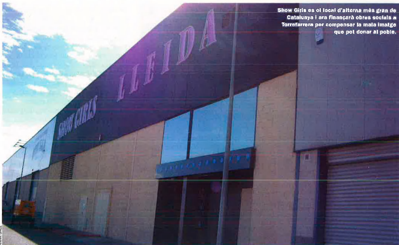
Show Girls es el local d'altorna més gran de Catalunya i ara finançarà obres socials a Torrefarrera per compensar la mala imatge que pot donar al poble.