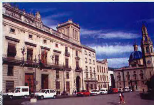
Ajuntament d'Alcoi "illa de catalans implantada al ronyó del Regne de València".

Alcoi va d'aniversari. Fa 750 anys. El 17 de març de 1256 el florentí del Regne de València, Eiximén Peres d'Arenós, va atorgar, en nom de Jaume I, des de Xàtiva, la Carta de Poblament d'Alcoi. Aquella autorització a possessionar-se d'unes heretats i a alçar uns habitatges suposava la fundació d'una nova vila. L'"Al-qui" musulmà era el nom d'una demarcació, on hi havia un castell i unes alqueries sufràgenes, sense cap centre urbà. Set segles i mig de la fundació d'un petit vilatge ben emparat pels rius Molinar i Riquer —"penjat als barrancs", segons G. Miró— i protegit pel sud —per la "Bandeja"— per un potent bastió. No és sols la llengua i la cultura, una marca dels orígens i del canvi radical del XIII és també l'urbanisme: les poblacions baixen de les muntanyes als plans, al temps que recuperen el disseny romà quadrícula dels carrers.