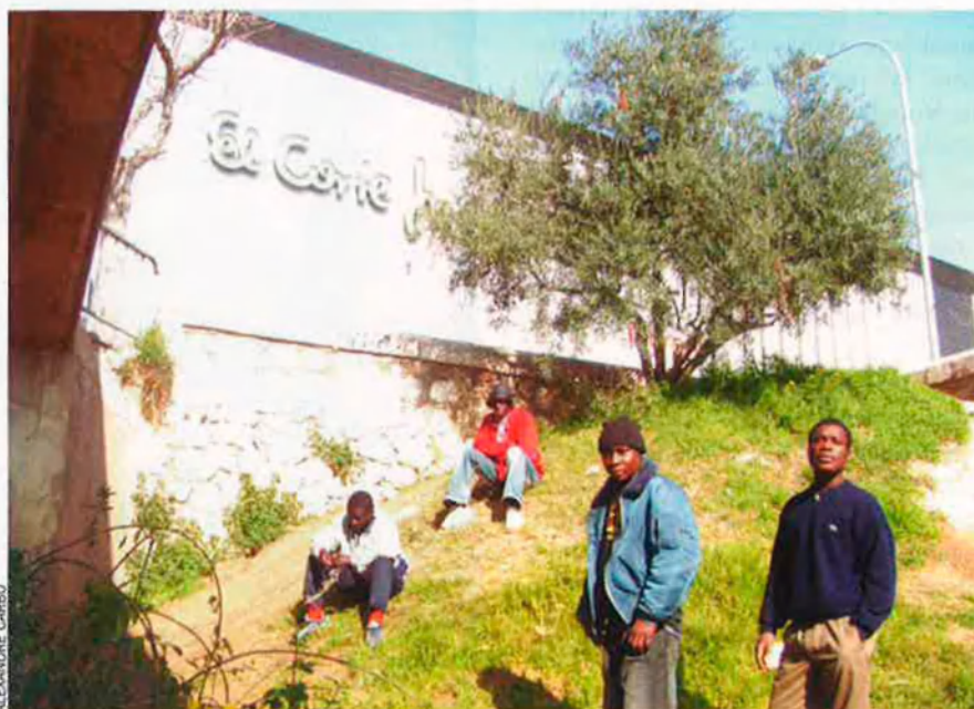
Aquest contrast tan pornogràfic és públic de fa mesos, a València. Les vergonyes de la nostra societat queden més al descobert que mai al llit vell del riu Túria.

Les dues cares del llit del Túria. En l'antic llit del riu Túria, a uns centenars de metres de la fastuosa Ciutat de les Arts i les Ciències, centenars d'immigrants passen les nits d'hivern emparats pels ponts. L'evidència del