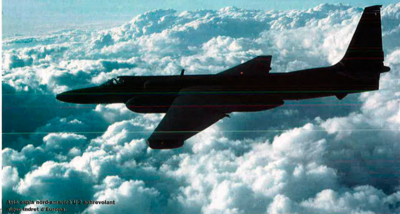
Avió espia nord-americà U-2 sobrevolant algun indret d'Europa.

Des de l'11-S, els serveis d'intel·ligència nord-americans han centrat els seus esforços en la lluita contra el terrorisme, però ONG i organismes internacionals acusen la CIA d'haver utilitzat el territori europeu per traslladar-hi detinguts i establir-hi presons secretes. Ara el Parlament europeu i el Consell d'Europa investiguen la veracitat d'aquestes acusacions i també si els governs de la UE han estat còmplices de les suposades activitats il·legals de la CIA en territori comunitari.