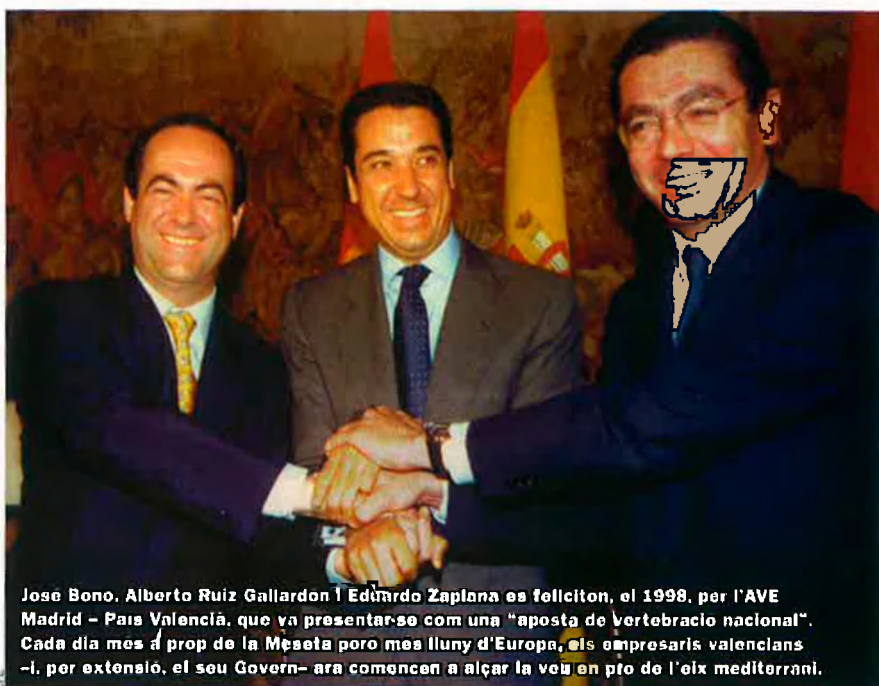
Jose Bono, Alberto Ruiz Gallardon i Eduardo Zaplana es feliciten, el 1998, per l'AVE Madrid – País Valencià, que va presentar-se com una "aposta de vertebració nacional". Cada dia més a prop de la Meseta però més lluny d'Europa, els empresaris valencians –i, per extensió, el seu Govern– ara comencen a alçar la veu en pro de l'eix mediterrani.

El ben cert, però, és que tampoc l'empresariat valencià no va ser capaç d'imposar-se en el si de la patronal espanyola, la CEOE. Aquesta, per majoria, defensava el conegut com "informe Van Miert", i les tímides veus discordants dels valencians no han servit de res. No era estrany: la CEOE resseguia l'esquema tradicional de l'estat centralitzat i, a més, aprofitava moltes de les vies ferroviàries ja existents, cosa que afavoria la