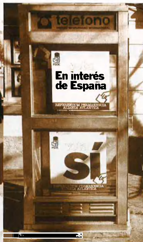
Entre ambdues imatges només hi ha quatre anys de diferència. L'any 1982 el PSOE recollia signatures en contra de la incorporació de l'estat espanyol a l'estructura de l'OTAN. L'any 1986 el mateix PSOE demanava el vot favorable en el referèndum sobre la mateixa qüestió.

panya a la Comunitat Econòmica Europea, el 12 de juny del 1985. A partir d'aquest moment el Govern ja podia presentar un argument afegit: l'europeïtzació d'Espanya passava per la integració dins del marc econòmic europeu, però també per mantenir el seu ingrés dins del sistema de defensa occidental. A desgrat de tot, quan va decidir tirar endavant la convocatòria del referèndum, es va trobar amb dificultats afegides: no solament perquè va haver de sacrificar el seu ministre d'Affers Exteriors, considerat poc atlantista—Fernando Morán fou substituït per Francisco Fernández Ordóñez—, sinó perquè havia de superar un estat d'opinió advers—les enquestes el novembre del 1985 pronosticaven que un 49% de la població s'oposava a l'OTAN, contra un 19%, que s'hi mostrava a favor—, mentre que el principal partit de l'oposició, Aliança Popular, de Manuel Fraga Iribarne, es manifestava contrari a la celebració del referèndum.