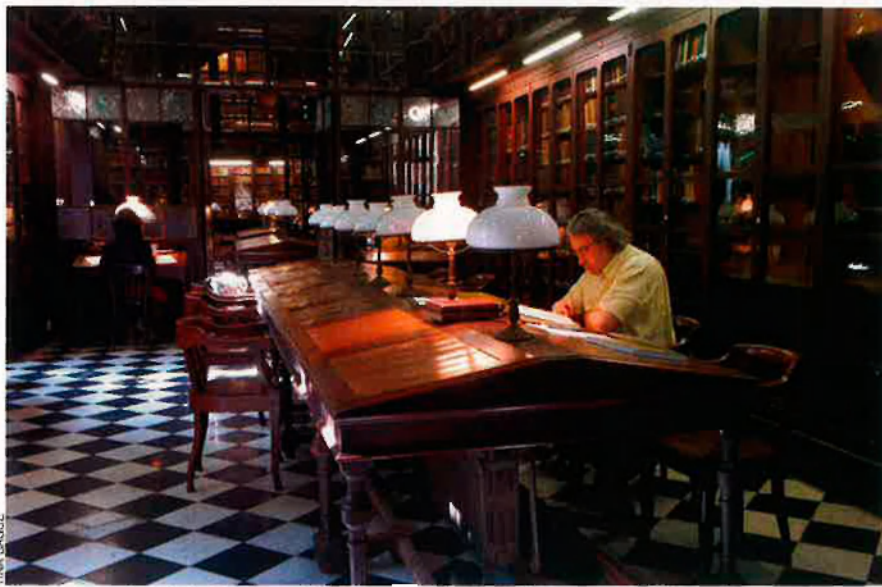
Una de les sales de la immensa biblioteca. És la joia de la corona de l'Ateneu Barcelonès i la més important biblioteca privada catalana, però d'accés lliure als socis.

El casalot va ser ampliat i reformat per adequar-se a les necessitats dels socis. L'estat d'eufòria d'aquells socis devia ser indescriptible. L'Ateneu es va convertir en la joia de la ciutat. Disposava de la millor biblioteca, la millor calefacció, les millors sales per fer-hi conferències i tertúlies, servei de bar, barberia i sales de joc –d'esgrima a cartes– i el pati més romàntic i discret de la ciutat. I va establir un sistema d'ingrés