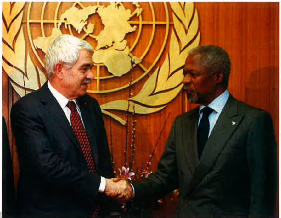
El president de la Generalitat de Catalunya, Pasqual Maragall, a la seu de l'ONU a Nova York, durant la seva estada als Estats Units. Des d'allà ha dit que l'èxit de la manifestació fa més possible que ERC entri en el consens de l'Estatut.

Alguns integrants de la direcció de Convergència han insinuat també que si el PSOE no manté els acords pactats, la federació podria plantejar-se –si arribés el cas– de proposar la retirada del text. Malgrat això, però, en les negociacions de l'Estatut de la setmana passada, del capítol IV corresponent a les competències, les desavinences entre les propostes del PSOE i els partits catalans, especialment en la gestió dels ports i aeroports o de les seleccions nacionals, no van comportar cap canvi significatiu de la federació en la seva voluntat ferma de tancar un acord. De fet, dins la federació hi ha qui considera que cal allargar el mínim imprescindible el procés de