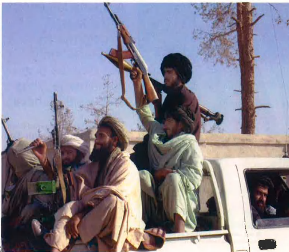
La guerra de l'Afganistan esdevingué la cobertura ideològica de la jihad internacional.

soreu. I sapiguen que, tant si moriu com si sou morts, a Déu sereu tornats” (3: 157-158). Fins i tot una sura alcorànica, la 61, As-Saff, pren el seu nom de la renglera d'una formació en combat: “Per cert que Déu aprecia els qui combaten en fila per llur causa, com si fossin una sòlida construcció” (aleia 4).