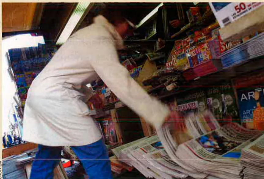
La llei antitabac prohibeix la venda als quioscos. Alguns quiosquers es queixen que el tabac ara el ganxo perquè el client comprés diaris i que ara perden un 40% dels seus ingressos.

un quiosc al carrer de Rosselló de Barcelona, i no va fer vaga: "La prohibició em perjudica relativament, però a mi em sembla que una reducció del 40% de les vendes, com diuen algunes associacions, no pot ser veritat. I si ho fos, els recomano que posin un estanc i de segur que els anirà molt bé..." El marge de benefici que obté un quiosc per cada paquet de tabac, independentment del seu preu de