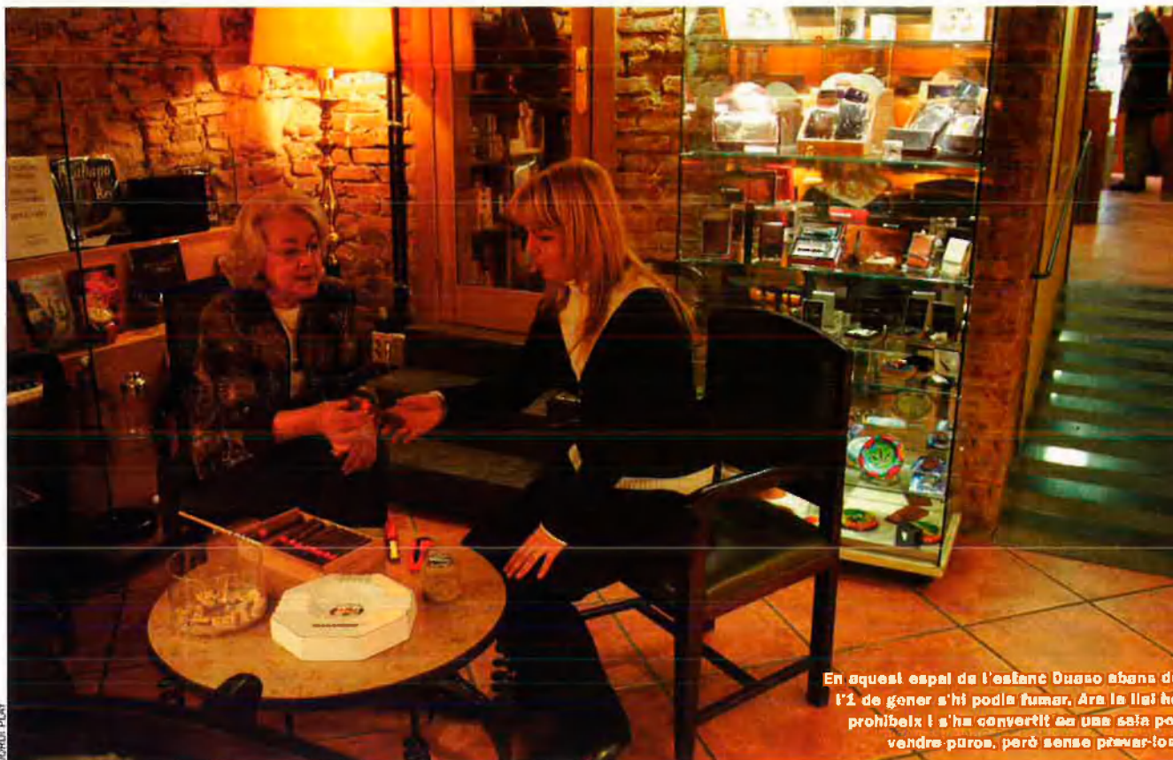
En aquest espai de l'estanc Duaso abans de l'1 de gener s'hi podia fumar. Ara la llei ho prohibeix i s'ha convertit en una sala per vendre paços, però sense premar-los

preocupen el més mínim, de manera que ens estem descapitalitzant". Segons els estancers, aquesta situació de crisi s'ha vist agreujada en el darrer any, sobretot amb l'aparició de marques de baix cost al mercat, de la llei de prevenció del tabaquisme, i ara, de la política de reducció de preus de les tabacaleres. A més, el gremi denuncia que "en el moment d'obrir nous estancs