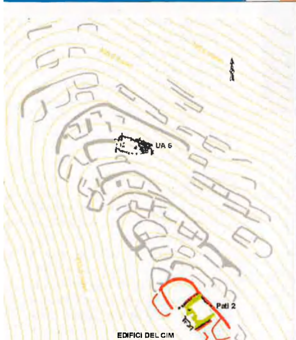
EL TRIGAL (Nasca, Ica, Perú). 2005.