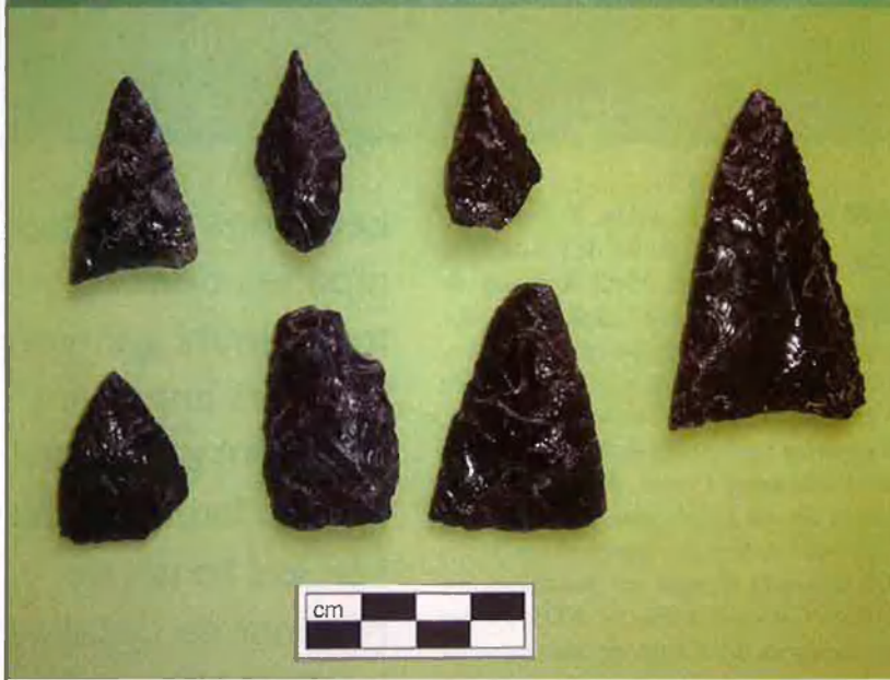
El jaciment de la serra de La Puntilla anomenat El Trigal es troba a 850 m d'alçada, en una zona desèrtica que s'estén cap al sud fins Antofagasta, a Xile. A l'esquerra, a sota, un plànol del Trigal, on s'han excavat estructures domèstiques (UA5) i el pati que concentrava el treball comú sobre tot allò que arribava al poblat. Allà s'han trobat objectes de Spondylus (a dalt, a la dreta), una closca de mol·lusc que cal cercar a 1.500 km d'allí, i puntes d'obsidiana, que només es troba als Andes, a 3.000 m d'alçada.

peruana del mateix nom, però aquesta classificació es basa simplement en el fet que comparteixen un tipus d'artesanaria, la qual cosa no és prova suficient de res, segons Castro: "Si algun dia, en el futur, prenguessin les ampolles de Coca-Cola trobades aquí com a única referència per incloure'ns en una cultura, les conclusions serien molt reduccionistes."