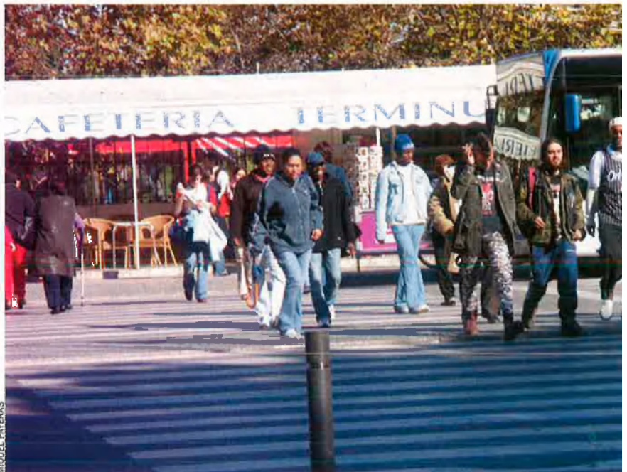
La immigració marca, profundament, en aquests moments la demografia balear en el seu conjunt, especialment la de la capital, Palma.

També la immigració marca profundament la demografia balear en el seu conjunt. Les dades de l'INE conegudes la setmana passada, referides als padrons municipals, revelen que la immigració cap a les Illes no para. Amb