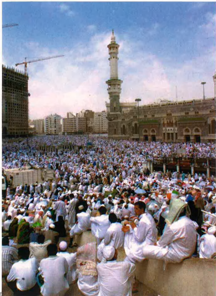
Els pelegrins amb la vestimenta d'ihram izar , que els cobreix la cintura i les cames, i de riḍā o wiḥāh , per al bust.