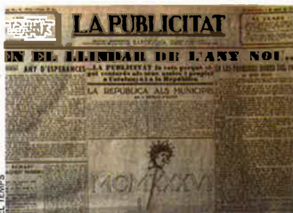
Entre el 1929 i el 1931 La Publicitat va acollir els "Telegrames" de Foix.

'Telegrames', recull de teletips de ficció plens d'humor i d'ironia, ha estat editat per la 'Nova Biblioteca Selecta'