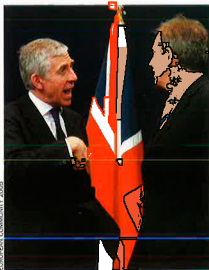
EUROPEAN COMMUNITY 2008

Quan a Europa només hi havia quinze països força rics de mitjana, Brussel·les aconseguia nivells de despesa real de l'1,14% del PIB, ja que el sostre s'havia situat molt més amunt. En canvi, en l'Europa dels Vint-i-cinc, en què el PIB en proporció s'ha reduït perquè els països de l'Est el tenen a uns nivells més baixos, el sostre de la despesa s'ha situat en un escàs 1,045% del PIB. I el que es gastarà de debò serà encara menys. I és que a Brussel·les els caps d'Estat i de Govern han aprovat el sostre, però cada any programaran un pressupost inferior per poder respondre a imprevistos. I el marge entre la teoria i la pràctica no és menyspreable. A la cimera, per exemple, els líders s'han inventat un fons