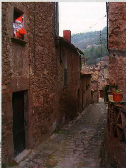
El Pare Solbes –en la foto a Mura (Bages)– es mostra més disposat a omplir el sac que a buidar-lo.

Els ninots Pare Noël que grimpen per les parets catalanes porten un sac a l'esquena, se suposa que ple de regals. Però vistes de lluny, aquestes figures decoratives donen molt mal rotllo, perquè semblen un lladre a punt de perpetrar el seu delicte. Ja se sap que l'home del sac té molta tradició entre nosaltres. Pare Solbes porta un sac i, de moment, es mostra més disposat a omplir-lo que a buidar-lo. I dels Reis, per reblar-ho, només podem esperar-ne carbó.