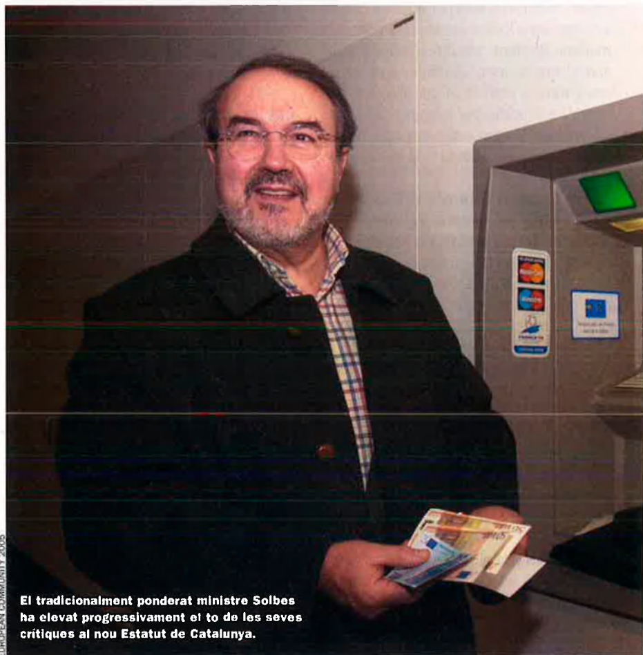
El tradicionalment ponderat ministre Solbes ha elevat progressivament el to de les seves crítiques al nou Estatut de Catalunya.

L'IVA i l'impost de societats són els dos grans impostos del futur, els que definiran un sistema tributari modern i eficient. Des de fa molts anys, aquests dos són els impostos que més augmenten en recaptació: l'any 2004 la recaptació de l'IVA va créixer un 9,7%, i la de l'impost de societats va créixer el 18,7% en el conjunt de l'estat, enfront del migrat 1,3% de l'IRPF i del 0,7% dels impostos especials. A Catalunya els increments van ser encara més grans: societats, 18%; IVA, 13%; mentre que l'IRPF només va créixer un 4%