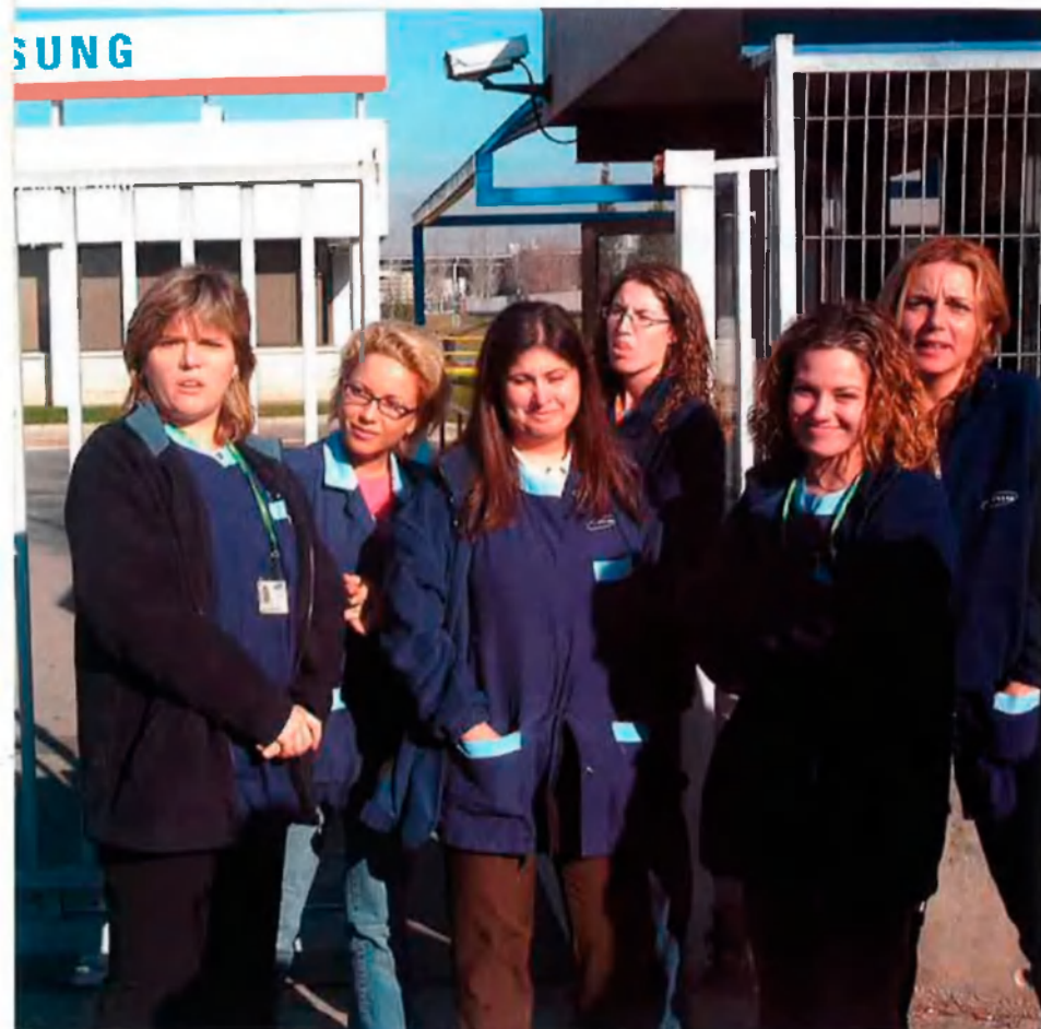
L'any passat la coreana Samsung va tancar la seva planta de Palau de Plegamans (Vallès Occidental) per traslladar-la a Eslovàquia, on la mà d'obra i els impostos són sensiblement més barats.

decideix fer una inversió es queda amb el tipus que ha de pagar i no mira inicialment la bateria de desgravacions que podrà aplicar-se més endavant", argumenta aquest expert. En la seva opinió, la millor manera de vendre's a fora és presentant un càrrega fiscal menor, ja que sovint bona part de les