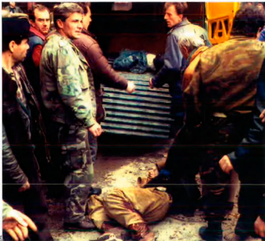
La ciutat bosniana de Sarajevo va ser una de les més castigades durant la guerra dels Balcans. Els cossos s'amuntegaven als carrers.

permanents). El nombre de ciutadans serbis que veuen l'amenaça de separació de Montenegro com un alleujament augmenta cada vegada més. El fet que una comunitat de 600.000 habitants exigisca representativitat igualitària enfront de l'altra, de 8 milions d'habitants, es considera un llast per al desenvolupament polític i econòmic de Sèrbia. La majoria dels partits polítics serbis sembla que hi estan d'acord, amb aquesta manera de pensar, de manera que, quan s'hi veuen obligats per les circumstàncies, en parlen amb la boca petita, d'aquesta qüestió. De fet, la Unió Europea sembla més preocupada pel futur d'aquesta federació que els mateixos serbis.