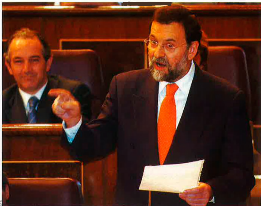
El president del PP, Rajoy, al Congrés de Diputats. Segons Madina, el PP no fa un discurs d'estat en aquest moment.

—El PNB té por de no arribar a temps a les últimes gotes d'aquest conflicte que ells diuen que existeix i pel qual alguns han estat disposats a matar.