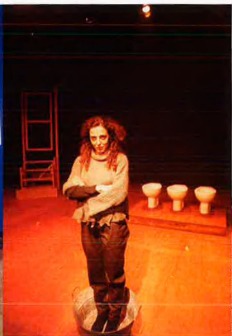
A l'esquerra, Sala Tantarantana. A sobre, Sala Artenbrut ja tancada definitivament.

una mena de combat entre vuit actors que puguen a l'escenari (en forma de ring de boxa) per enfrontar-se un a un, improvisant. És una situació insòlita en què els contendents alhora es necessiten. Paral·lelament, a la sala hi fan cicles de cinema o representacions teatrals. I cal esmenar també una curiositat: properament oferirà Diari