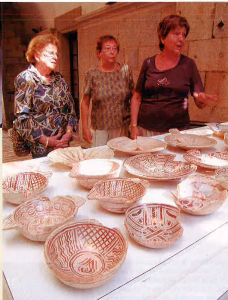
Diverses mostres de ceràmica trobades a les excavacions. Al conjunt de la foto superior hi ha també un capitell.

A Girona, les primeres crítiques van sorgir de la portaveu municipal de CiU, Zoila Riera, la qual no ha demanat la conservació íntegra de les restes, però sí parcial, de manera que les pedres antigues es puguin integrar en l'obra acabada. Unilateralment, el lli-