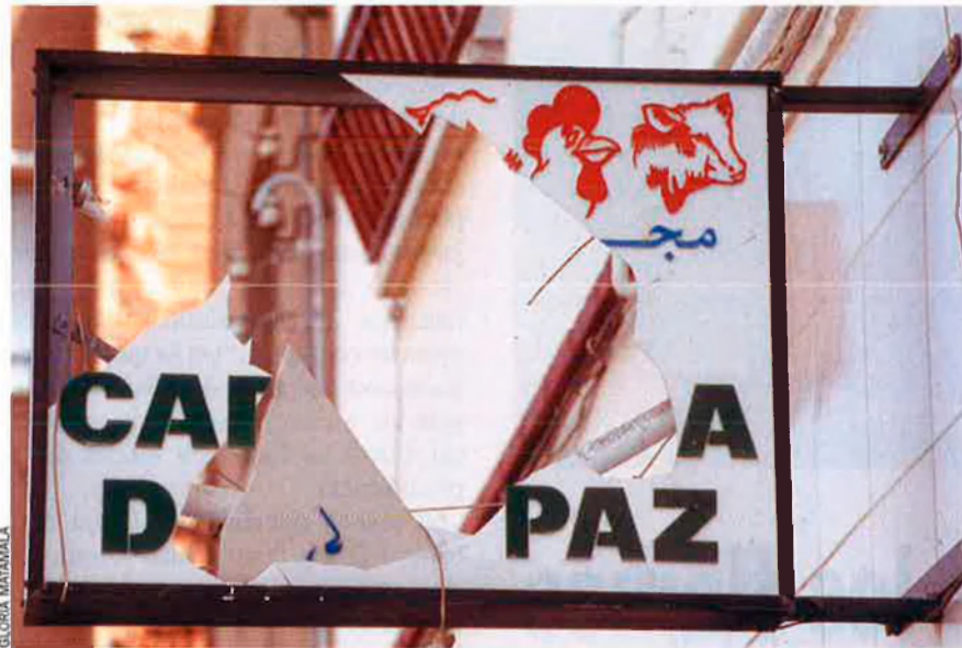
El nostre país també ha viscut incidents vandàlics relacionats amb la immigració, com els que s'esdevingueren l'any 1999 al barri terrassenc de Ca n'Anglada, però en aquell cas les víctimes van ser els magribins. A la foto, destrosses produïdes en una carnisseria àrab.

buit entre barris i estat. Aquesta distància s'ha fet encara més gran amb la desaparició de les organitzacions socials que actuaven en aquests barris: “Ara, a França –explica Aubarell–, a diferència de les revoltes dels setanta, ja no hi ha el teixit social intermedi que feia de coixí.”