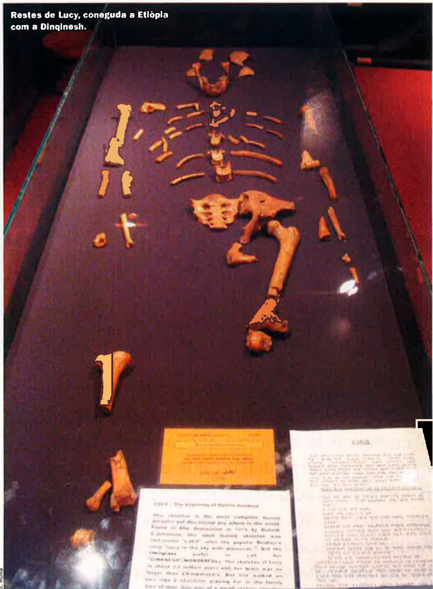
Restes de Lucy, coneguda a Etiòpia com a Dinqinesh.