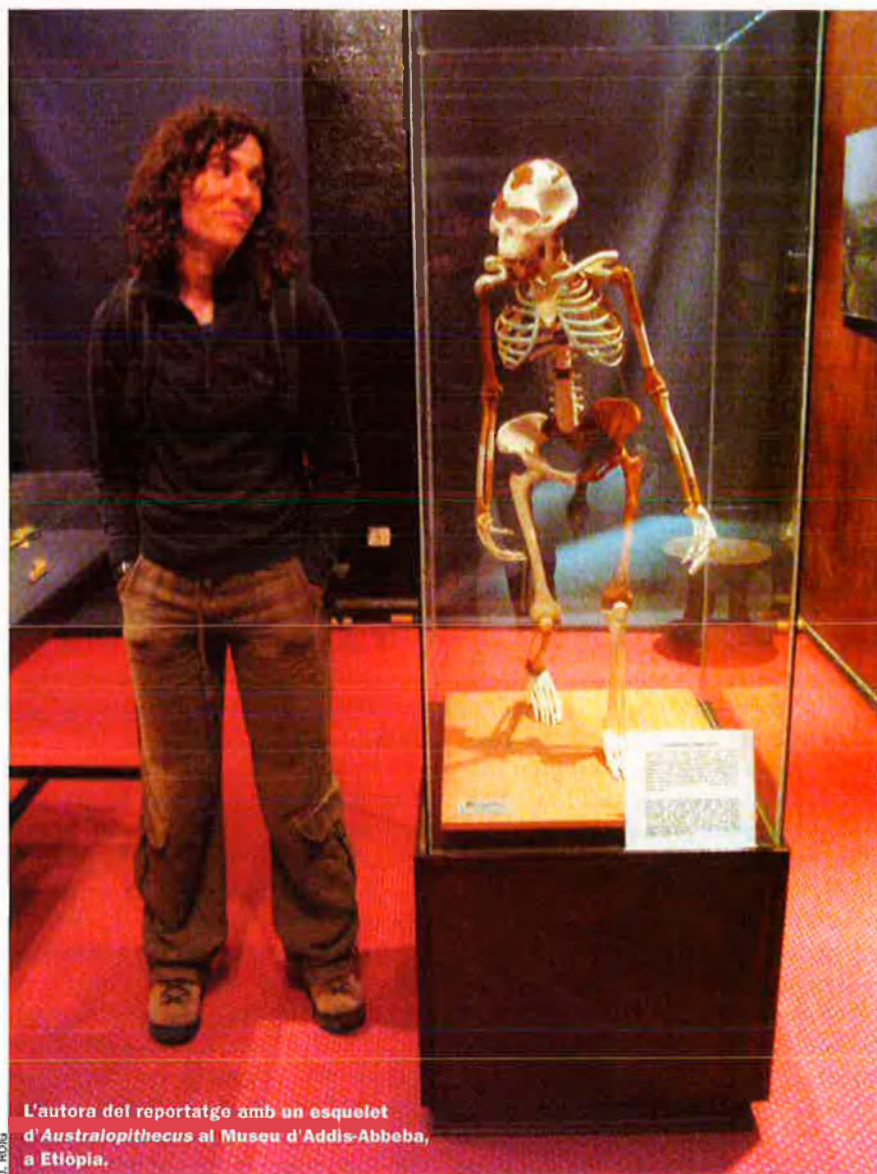
L'autora del reportatge amb un esquelet d' Australopithecus al Museu d'Addis-Abbeba, a Etiòpia.

noma de Barcelona, "l' enamorament tendeix a fer més sòlids els vincles de parella i obre a això que en diem 'amor', que d'alguna manera equival a una elaboració mental complexa més enllà de l'enamorament". I les dones, aquí, també hi representen un paper curiós. L'orgasme femení n'és una mostra. Segons els nostres coneixements, no hi ha cap altra femella en el regne animal que pugui gaudir d'aquesta sensació, o almenys, amb una intensitat semblant.