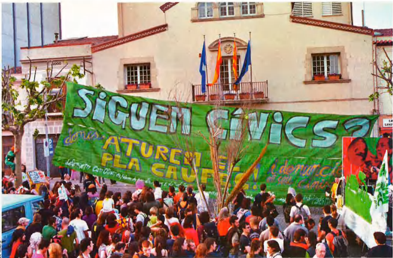
La plataforma popular d'oposició al pla Caufec ha organitzat diverses mobilitzacions de protesta com aquesta, davant l'Ajuntament d'Esplugues de Llobregat de l'abril del 2005.

“una immensa taca de ciment a un espai natural com aquest”.