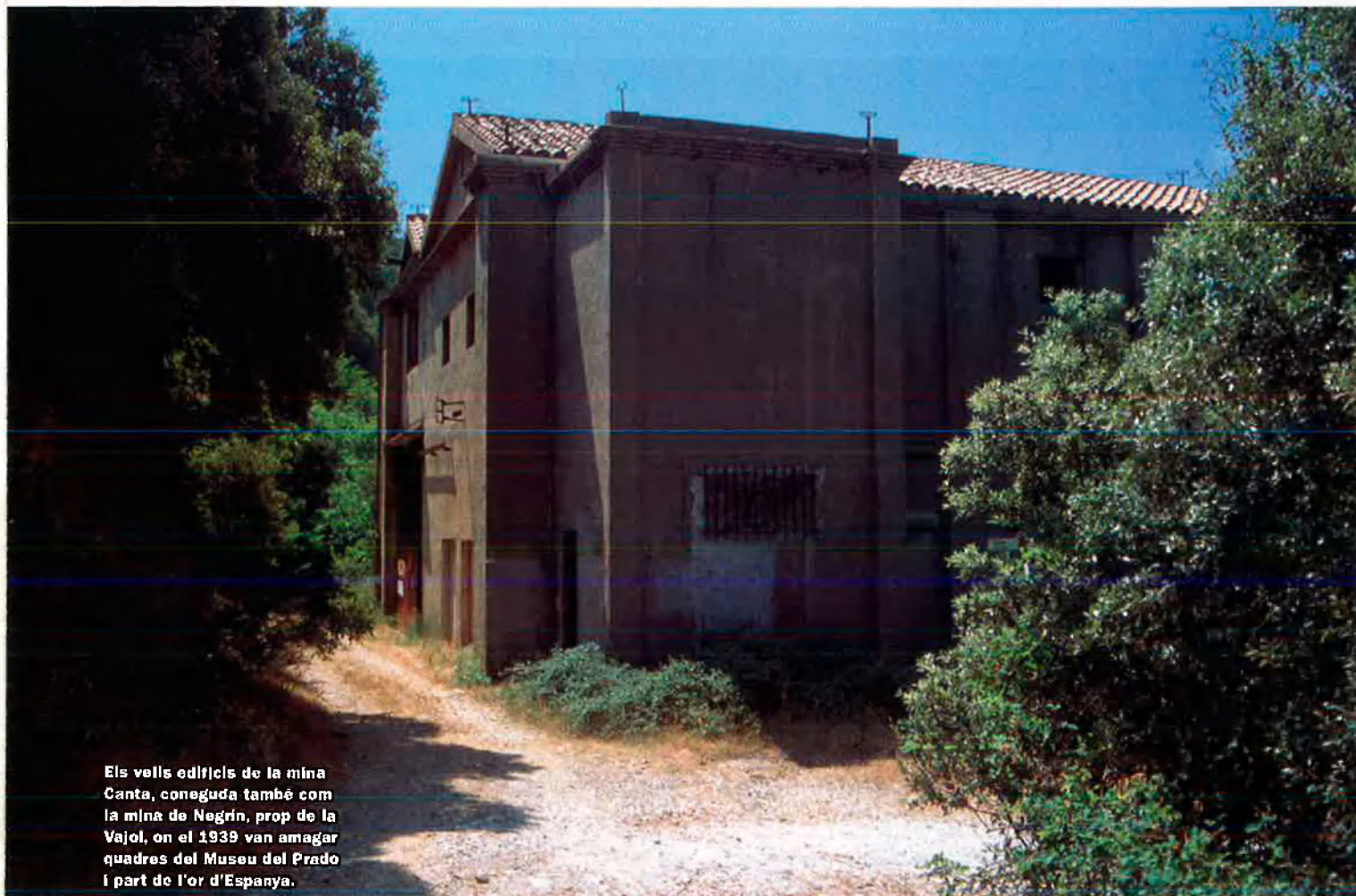
Els vells edificis de la mina Canta, coneguda també com la mina de Negrín, prop de la Vajol, on el 1939 van amagar quadres del Museu del Prado i part de l'or d'Espanya.

ubicació, just al costat de la frontera, la que va fer que Negrín hi enviés obres d'art del Prado i part de l'or del Banc d'Espanya, que en total els historiadors han valorat en 500 milions de dòlars. Dins de la mina es va fer construir una cambra cuirassada, on van quedar dipositats l'or i els quadres sota la responsabilitat directa del ministre d'Economia i Hisenda.