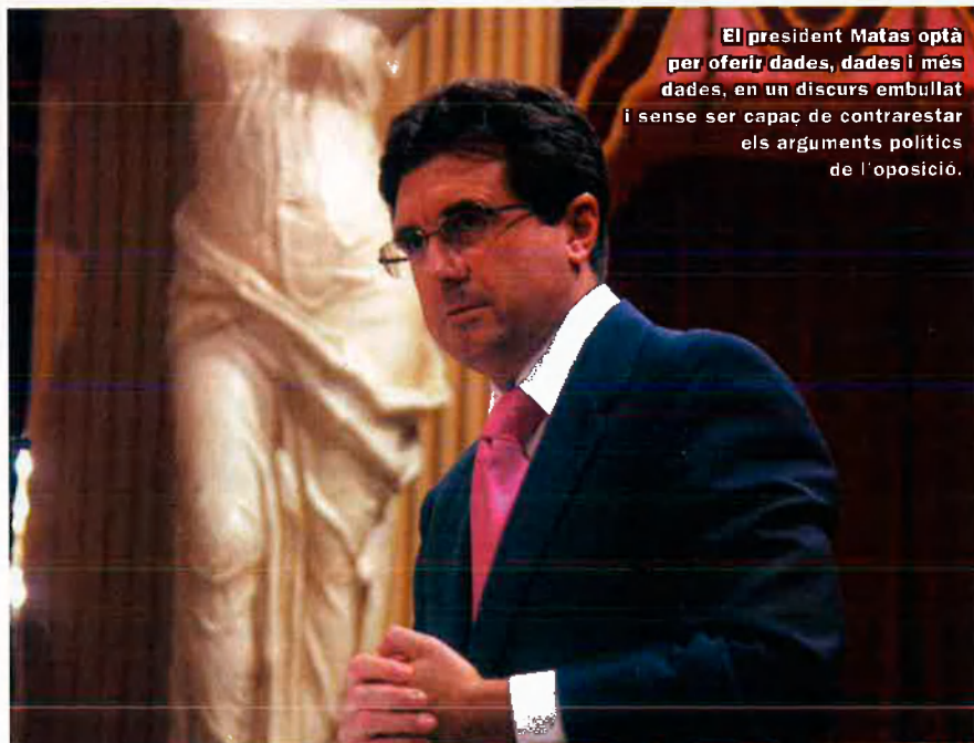
El president Matas optà per oferir dades, dades i més dades, en un discurs embullat i sense ser capaç de contrarestar els arguments polítics de l'oposició.

Turisme, infraestructures i economia. El discurs presidencial de dimarts demostrà què interessa al Govern. Dedicà 58 minuts —d'un total d'hora i tres quarts— a congratular-se per “l'eficiència i eficàcia” del seu Govern a donar “respostes pràctiques al que el ciutadà reclama”, que és, a saber: autopistes, autovies i, en general, noves carreteres; “recuperació” del turisme i desenvolupament econòmic. Per al president Matas aquests tres vectors de la seva gestió demostren que el “passat” s'ha superat en positiu. És a dir, que en els temps del Pacte de Progrés no es donà resposta a les “necessitats imprescindibles d'infraestructures, que eren pròpies de països del Tercer Món”, es posà en perill el