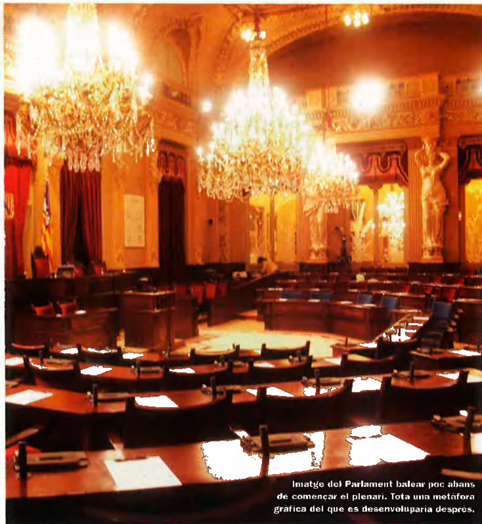
Imatge del Parlament balear poc abans de començar el plenari. Tota una metàfora grafica del que es desenvoluparia després.