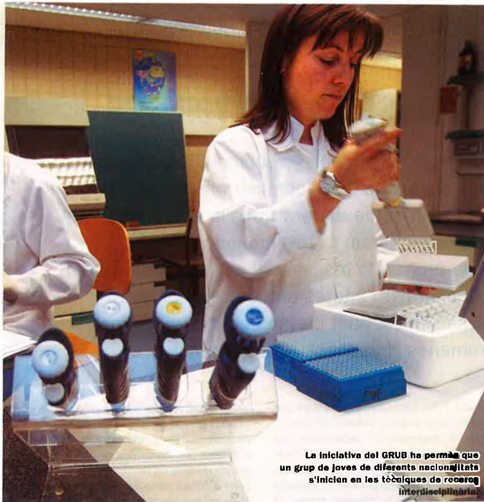
La iniciativa del GRUB ha permès que un grup de joves de diferents nacionalitats s'inicien en les tècniques de recerca interdisciplinària.

Europeu per a les Matemàtiques i la Indústria, reuneix una quarantena d'estudiants de l'últim any de la llicenciatura de matemàtiques i de doctorat per promoure l'ús d'aquesta ciència, sovint títolada de massa abstracta i poc útil, en la resolució de problemes 'del món real'. Així, en tallers intensius, també de cinc persones i heterogenis pel que fa a nacionalitat, especialitat i experiència, els participants han hagut d'aportar solucions a un problema de modelització concret originat a la indústria, el comerç o en altres sectors de la societat. Alguns dels reptes que han hagut de superar són l'optimització de la il·luminació d'un camp d'esports que té un determinat nombre de llums; la millora de l'obtenció de dades amb microxips d'ADN—problema proposat per la indústria farmacèutica sueca— o la modelització dels processos de pol·lució en llacs en què hi ha un excés de formació d'algues, qüestió proposada per l'Agència Ambiental Finesa.