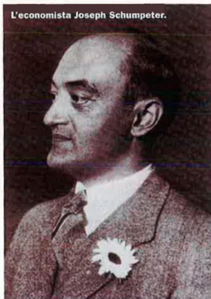
L'economista Joseph Schumpeter.

—Per què el capitalisme s'ha de domesticar?