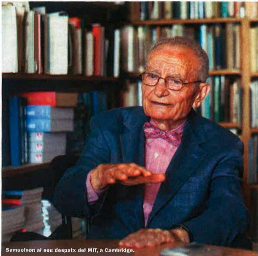
Samuelson al seu despatx del MIT, a Cambridge.

cional, però també ens porta inseguretat i tensions afegides, a més d'un augment de la desigualtat. A Amèrica això és una causa d'aterroriment entre els empleats.