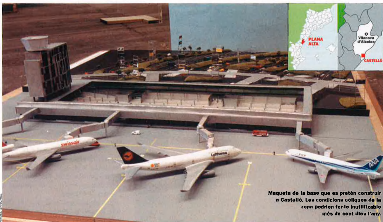
Maqueta de la base que es pretén construir a Castelló. Les condicions ecològiques de la zona podrien fer-lo inutilitzable més de cent dies l'any.

no va aconseguir que la CAM assumira el 15% de les seues accions per culpa de les guerres internes del PP al País Valencià. L'entrada garantida ja per Bancaixa en l'accionariat, també amb un 15% i amb una inversió de 5 milions d'euros, encara no s'ha formalitzat.