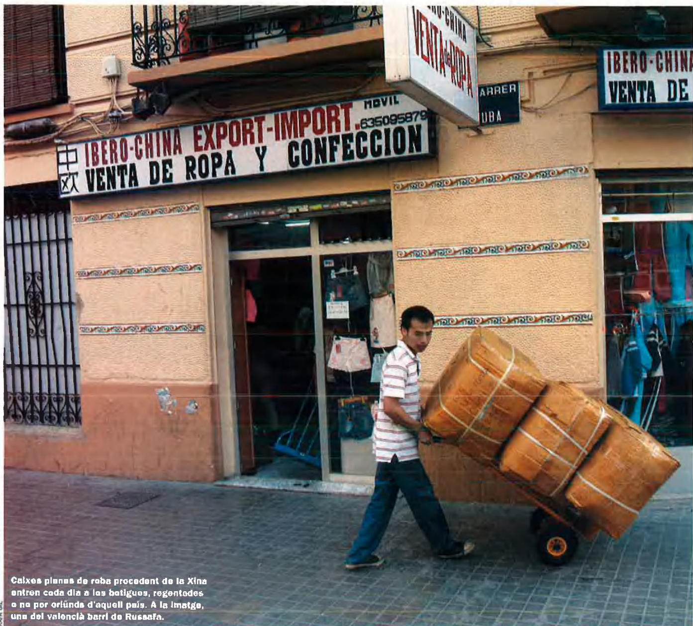
Caixes plenes de roba procedent de la Xina entren cada dia a les botigues, regentades o no per oriünds d'aquell país. A la imatge, una del valencià barri de Russafa.