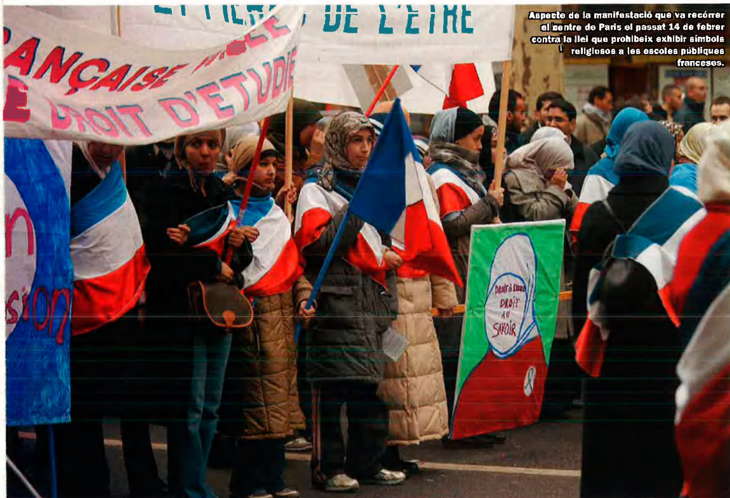
Aspecte de la manifestació que va recórrer el centre de París el passat 14 de febrer contra la llei que prohibeix exhibir símbols religiosos a les escoles públiques franceses.