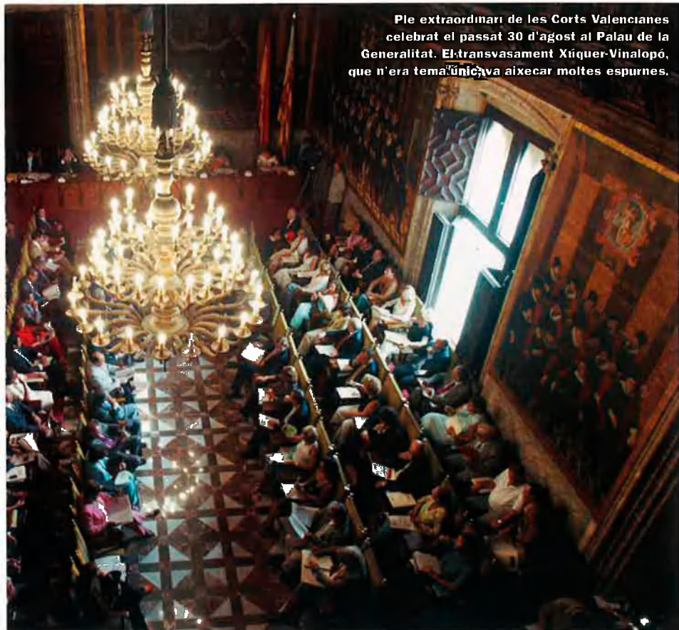
Ple extraordinari de les Corts Valencianes celebrat el passat 30 d'agost al Palau de la Generalitat. El transvasament Xúquer-Vinalopó, que n'era tema únic, va aixecar moltes espurnes.

Aigües, que cada dijous imparteix justícia sobre drets i deures a les séquies del riu Túria. Per la tensió del debat, però també per la disposició de les senyories, el marc recordava la Cambra britànica, (per cert, les botelles d'aigua, eren de la marca Cortes –de Cortes d'Arenós, Alt Millars, però), i a la sala de premsa on seguien la sessió els periodistes, un únic cartell, que deia: “L'aigua font de vida. 22 de març, dia internacional de l'aigua.”